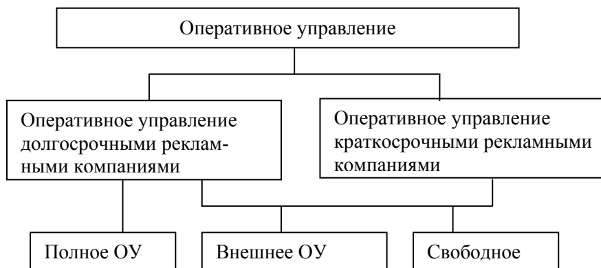
Рис. 1. Классификация ОУ

Нами предложена следующая классификация оперативного управления рекламой (рис. 1):