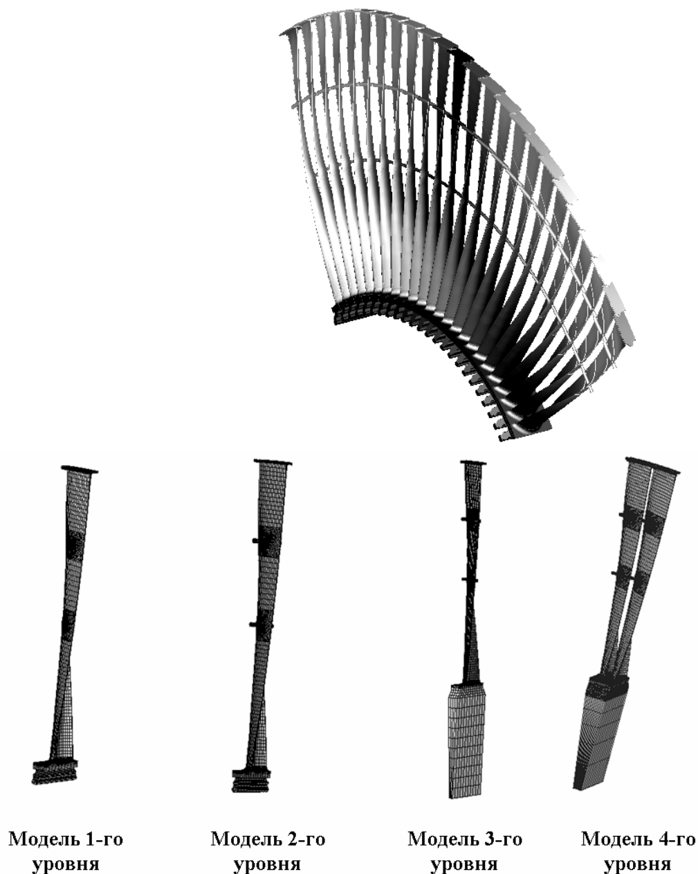
Рис. 1. Иерархическая последовательность пространственных КЭ моделей.

Модель 4-го уровня представляет собой пакет из 2 лопаток и предназначена для исследования влияния на собственные частоты колебаний предварительного напряженного состояния с учетом контактных взаимодействий в бандаже, демпферных связях и хвостовом соединении.