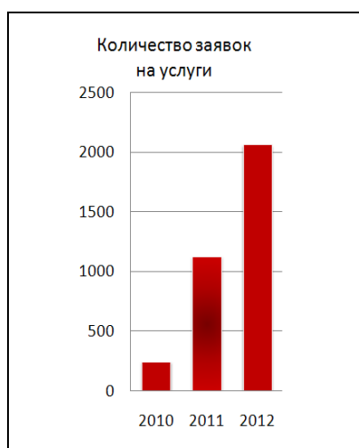
Рис. 2. Статистика заявок на услуги МБА, ЭДД, бронирование документов в 2010–2012 гг.

О востребованности услуг по МБА, ЭДД, бронированию свидетельствует статистика за 2010–2012 гг. (рис. 2). В АРМе МБА/ЭДД формируется сводный отчет по использованию корпоративных услуг. Можно также узнать статистику по заказам в каждую библиотеку КСОБ СПб и время, затраченное на их выполнение. Данные статистики показывают почти восьмикратное увеличение заказов на указанные услуги на второй год функционирования портала КСОБ СПб.