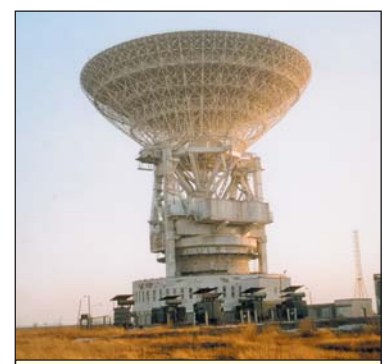
Антенная установка СМ-214АУ с зеркалом диаметром 70 м

но с рядом смежных предприятий и изготовленных в его цехах, были пущены обе ракеты «Энергия» (15 мая 1987 г. и 15 ноября 1988 г.).