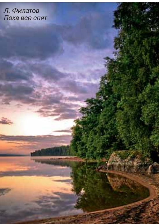
Л. Филатов Пока все спят

Учредитель газеты: Санкт-Петербургский государственный политехнический университет Газета зарегистрирована исполкомом Ленинградского горсовета народных депутатов 21.01.91 г. № 000255