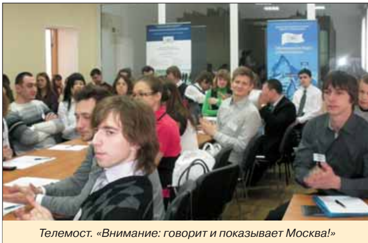
Телемост. «Внимание: говорит и показывает Москва!»

29 апреля 2010 г. в помещении ИТТ-отделения информационно-телекоммуникационного комплекса (4 кор.) СПбГПУ прошла вторая бизнес-дуэль в формате телемоста на тему «Создание и продвижение на российский рынок нового продукта. Все этапы проекта – от производства до реализации». Организаторы – группа компаний «Молодой карьерист», Академия народного хозяйства при Правительстве РФ и Международная высшая школа управления Политехнического университета.