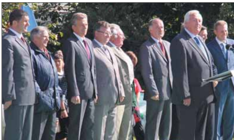
От официальных лиц – неофициальные напутствия

Подробности – на странице «Студенческая наука» в разделе «Научная работа» сайта СПбГПУ.