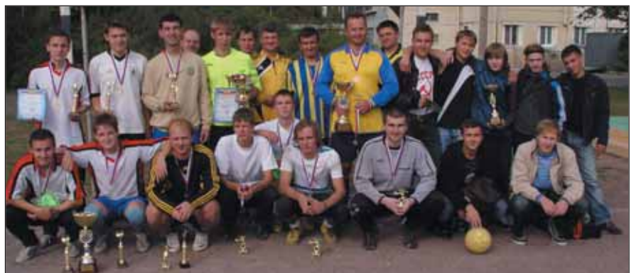
Призеры 27-го турнира по футболу