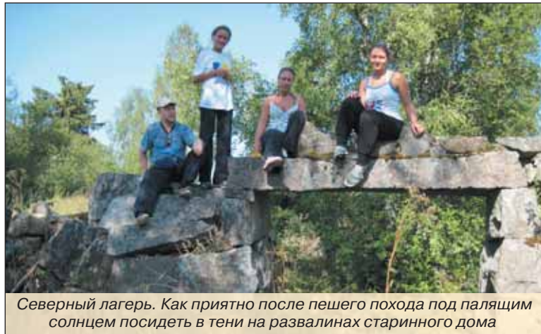
Северный лагерь. Как приятно после пешего похода под палящим солнцем посидеть в тени на развалинах старинного дома