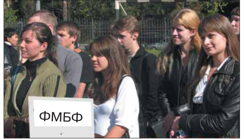
Ю.С. ВАСИЛЬЕВ, президент СПбГПУ, вып. гидротех. ф-та ЛПИ:

– Мое пожелание первокурсникам – развивайте ваши эстетические наклонности! Сейчас возрождается студенческая художественная самодельность: вокальная студия, инструментальный ансамбль, рок-студия. Мы существуем параллельно со