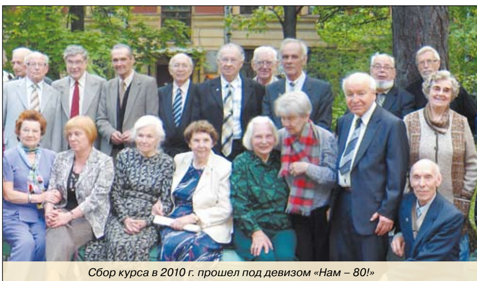
Сбор курса в 2010 г. прошел под девизом «Нам – 80!»

НАШ КУРС «ПРИНЯЛ И БЛАГОСЛОВИЛ НА ПУТЬ В НАУКУ» АКАДЕМИК АБРАМ ФЕДОРОВИЧ ИОФФЕ