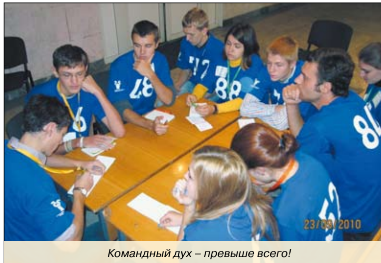
Командный дух – превыше всего!

Ближайшая школа, в которой примут участие стипендиаты из вузов Санкт-Петербурга и других городов европейской части России, пройдет в Сочи с 31 января по 4 февраля 2011 года.