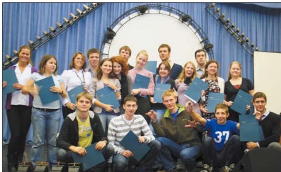
Стипендиаты Благотворительного фонда Владимира Потанина

20 сентября в ведущих вузах Санкт-Петербурга стартовал очередной конкурс отбор по Федеральной стипендиальной программе Владимира Потанина, которая действует с 2000 г. В ней приняли участие СПбГУ, СПбГУЭФ, СПбГПУ, РГПУ им. А.И. Герцена, СПбГУ ИТМО. В борьбу за стипендию вступили студенты дневных отделений, имеющие отличные оценки за две последние сессии. По итогам отборов наиболее талантливые и активные в течение года смогут получать дополнительную выплату в размере 3500 руб. в месяц. Имена двадцати политехников, ставших обладателями этой стипендии, уже названы.