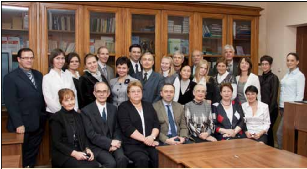
Коллектив кафедры «Информационные системы в экономике и менеджменте», 2011 г.