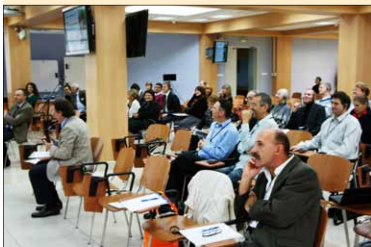
Открытие 2-го международного семинара РМУнИ 2011 г.