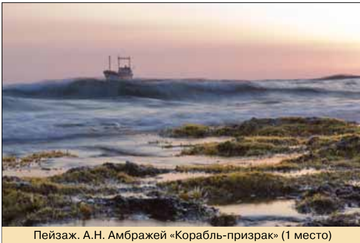
Пейзаж. А.Н. Амбражей «Корабль-призрак» (1 место)