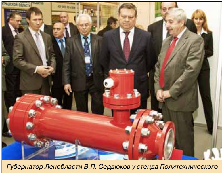
Губернатор Ленобласти В.П. Сердюков у стенда Политехнического

Полный текст приказа опубликован на официальном сайте www.spbstu.ru