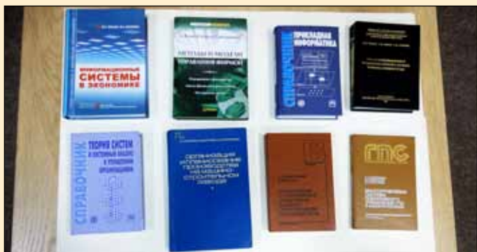
Учебники и монографии - наш научный капитал