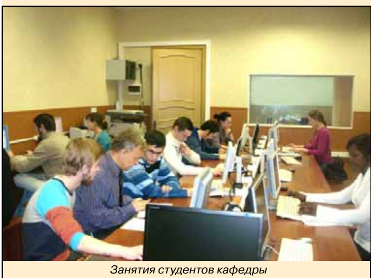
Занятия студентов кафедры