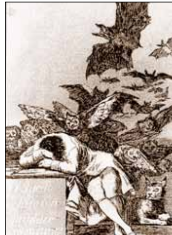
Ф. Гойя. Сон разума рождает чудовищ

С переходом на «уровневую систему» образования, на стандарты 3-го поколения (ФГОС-3) ситуация в корне изменилась. Дисциплины КСЕ больше нет в числе базовых предметов математического и естественнонаучного цикла! Мы фактически вернулись к началу 1990-х годов, и это встретило крайне негативную реакцию научно-педагогической общности.