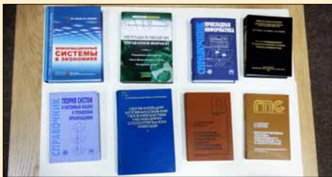
Учебники и монографии - наш научный капитал