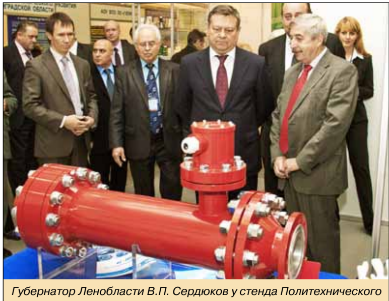
Губернатор Ленобласти В.П. Сердюков у стенда Политехнического

XL ЮБИЛЕЙНАЯ МЕЖДУНАРОДНАЯ НАУЧНО-ПРАКТИЧЕСКАЯ КОНФЕРЕНЦИЯ