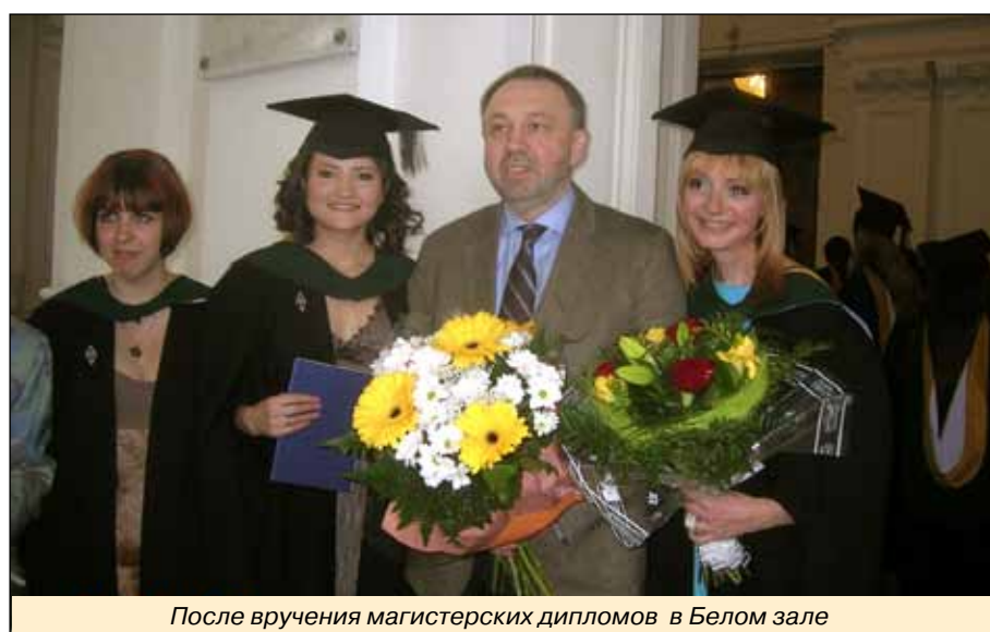
После вручения магистерских дипломов в Белом зале