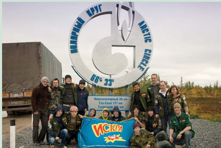
2011 г. Новый Уренгой