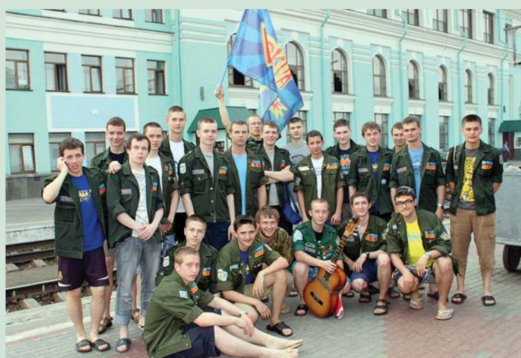
2012 г. Иркутск