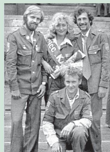
1977 г. Мисс Карелия и штаб «Искры»-77