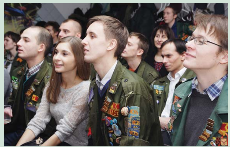
2012 г. Слушая ветеранов: «Искре» — 35 лет