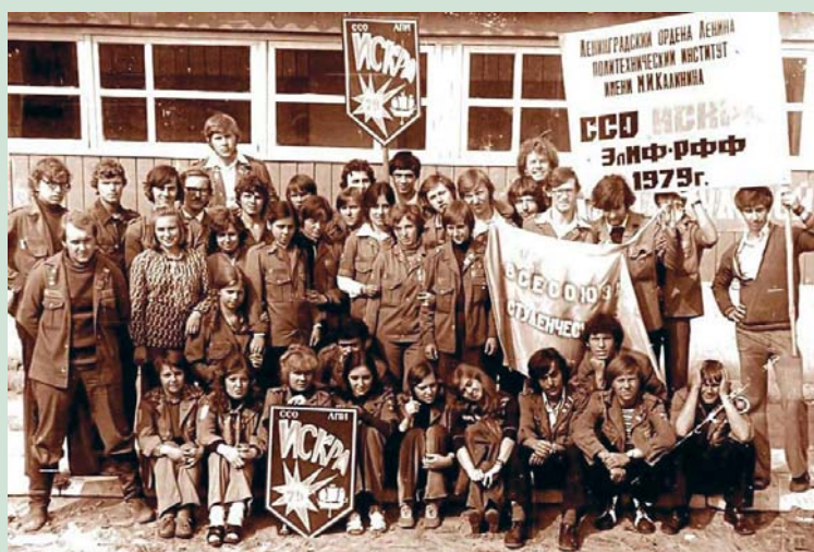
1979 г. В День строителя в пос. Лепсари Всеволожского района