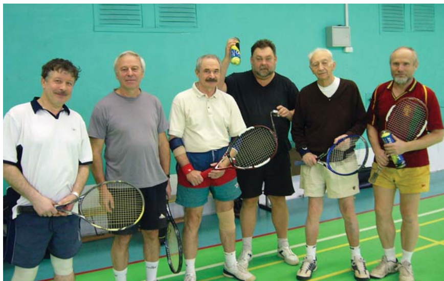
Участники финальных парных игр

К 35-ЛЕТИЮ ШАХМАТНОГО КЛУБА ИМ. М.М. БОТВИННИКА