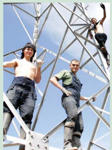
2011 г. Романтика ЛЭП