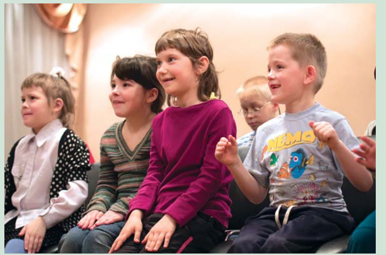
Приют Дом милосердия: улыбки детей – бесценный дар