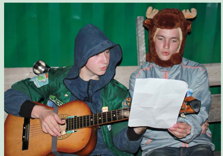
2011 г. На досуге (командир и комиссар)