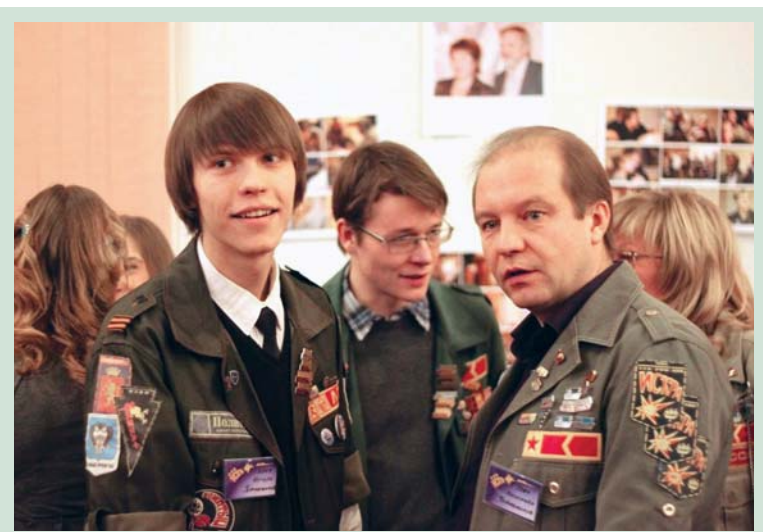
На юбилейном вечере «Искры»

И все-таки, чтобы узнать, что такое отряд, нужно стать его частью. Попробуй, тебе понравится! Хотя бы месяц-другой поживёшь по-человечески!