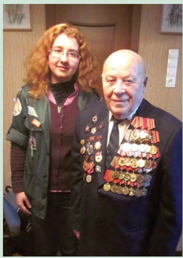
В гостях у ветерана

Эту цель поставило перед собой сообщество добровольцев «Вместе», появившееся в нашем вузе два месяца назад. Инициаторами такого объединения стали представители студенческих отрядов СПбГУ. Молодежь решила помогать воспитанникам детских домов и интернатов, а также ветеранам и пенсионерам.