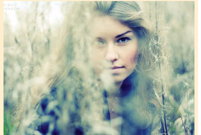
В коллаже использованы авторские работы с выставки «Политех-Фото»