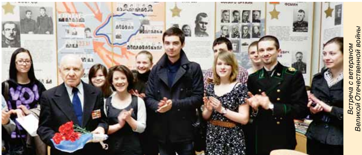
Встреча с ветераном Великой Отечественной войны