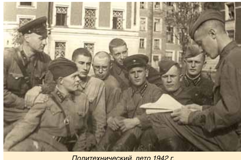
Политехнический, лето 1942 г.

ВЫЕЗДНОЕ ЗАСЕДАНИЕ ТОРГОВО-ПРОМЫШЛЕННОЙ ПАЛАТЫ