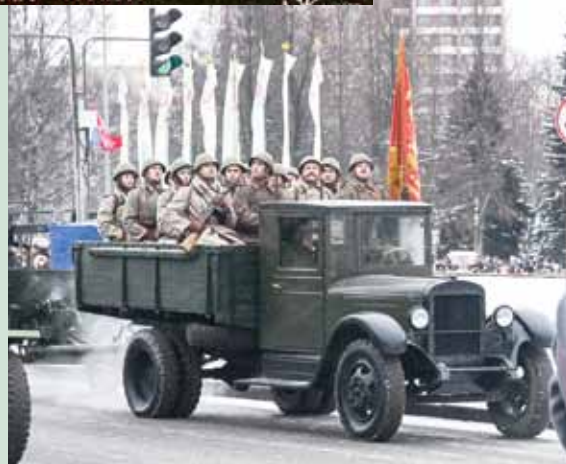
Политехники на праздничном параде