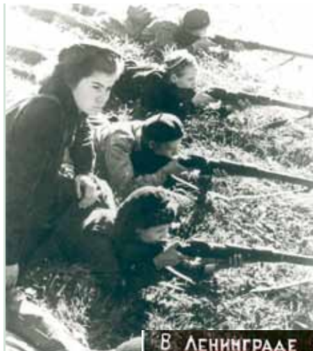
На выставке «Ленинград сквозь блокаду»