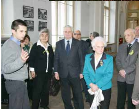
На выставке «Ленинград сквозь блокаду»

В ЛЕНИНГРАДЕ НЕТ ГРАНИ МЕЖДУ ФРОНТОМ И ТЫЛОМ ВСЕ ЖИВУТ ОДНОЙ МЫСЛЮ, ОДНИМ ДУХОМ – ВСЕ СДЕЛАЮТ ДЛЯ РАЗГРОМА ВРАГА.