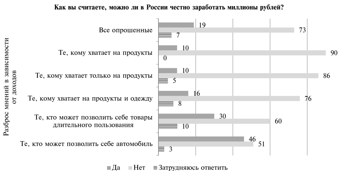
Рис. 1. Данные опроса ВЦИОМ и Левада-центра

Обратимся к новейшим тенденциям в развитии малого и среднего предпринимательства. В рейтинге благоприятности деловой среды «Doing Business-2012», который ежегодно составляют Всемирный банк и Международная финансовая корпорация (IFC), по итогам 2011 г. Россия занимала 120-е место, годом ранее – 123-е место [4].