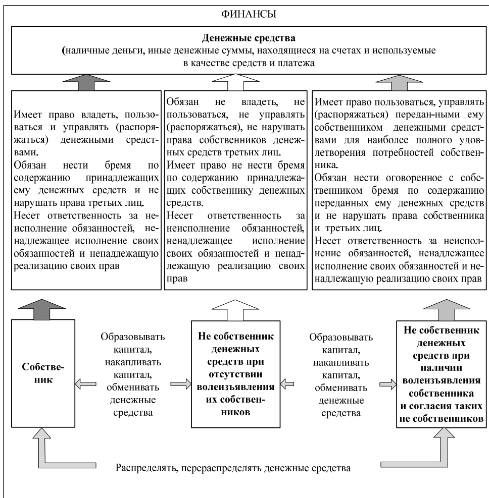
Рис. 2. Детализированная морфология финансов

Совершенно очевидно, что в высококвалифицированных специалистах заинтересовано, прежде всего, само общество. Классическая Марксова категория обозначает «способ производства материальной жизни» как единство производства материальных благ (экономический способ производства) и производства человеческого поколения (социальный способ производства). Именно поэтому общество должно было бы в рамках социального способа производства обеспечивать финансирование образования. Однако появление и использование в российской постсоциалистической стабильной модели «трехслойного пирога» из форм собственности, который возник на месте форм «социалистической собственности», привело к целому ряду проблем в обеспечении финансирования образования.