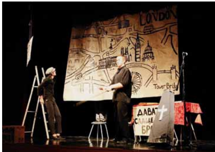
Сцена из спектакля театра

Ждем вас 1 марта в 15 час. на Полюстровском пр., 14. Вход – свободный.