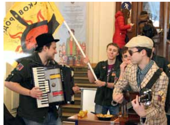
Выездное «Евровидение» – бойцы ССО «Скворода» исполняют песню «Северный Плесецк», написанную во время работы на ВСС «Поморье»