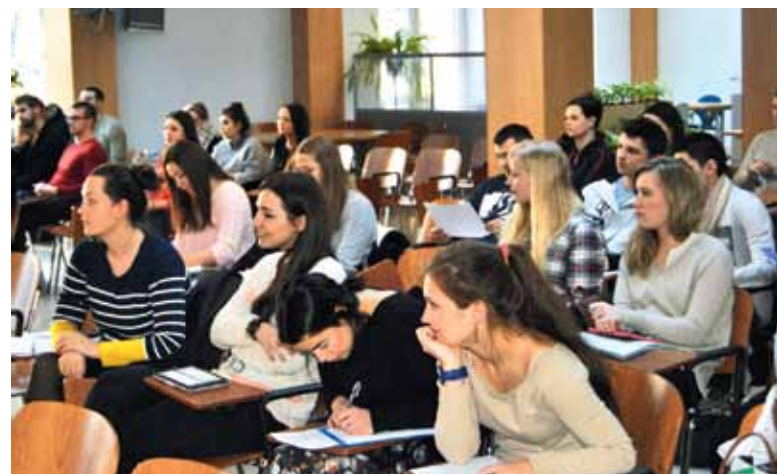
Открытие международной образовательной программы «Международный бизнес Россия – Европа»

Руководство института планирует максимально использовать высказанные сотрудниками идеи при построении планов развития и обсуждать новые шаги на аналогичных сессиях раз в полгода. Некоторые инициативы уже начали реализовываться в межкафедральных рабочих группах и на кафедрах.