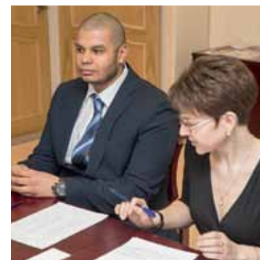
Протокол распределения подписан – впереди интересная работа!

В этот вечер с творческими подарками выступили студенты, выпускники и педагоги. А после окончания концерта настало время общения в неформальной обстановке.