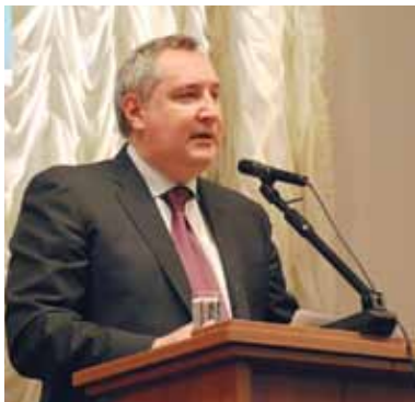
Заместитель председателя Правительства РФ Д.О. Рогозин