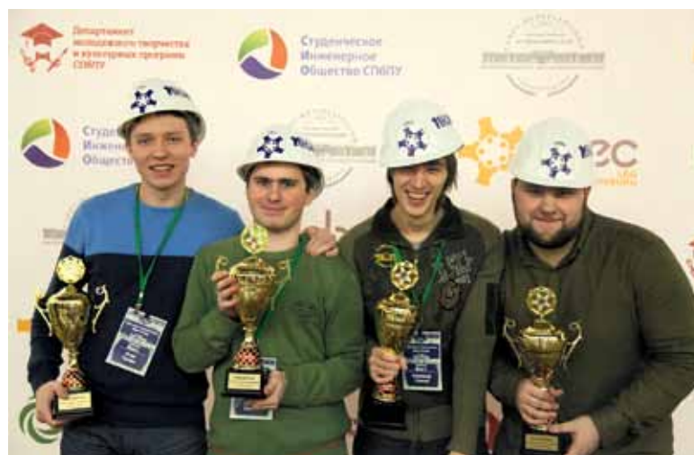
Команда ИИТУ «Манго» – победители в категории Team Design

Инженерные соревнования – один из способов решения проблемы подъема привлекательности технического образования в России. Студенты, участвующие в соревнованиях получают возможность проявить себя в решении действительно актуальных научных и технических кейсов на практике или в теории.