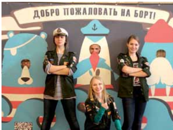
Бойцы студенческого педагогического отряда «Алые Паруса» приглашают всех желающих отправиться в дальнее плавание