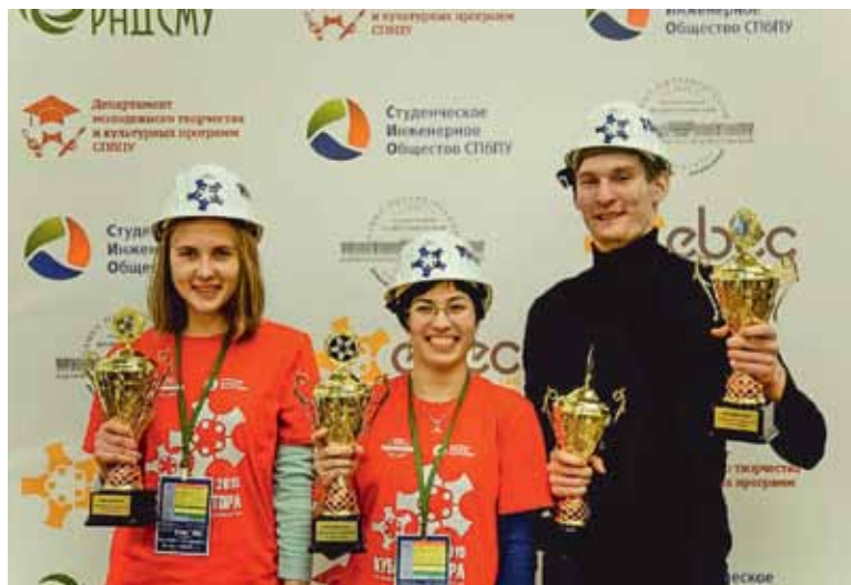
Команда ИИТУ «ФСР» – победители в категории Business Case

В Политехническом «Кубок ректора», который имеет уже свою большую историю, проходит на высоком уровне. Чтобы перенять опыт проведения меро-