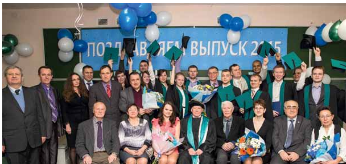
14-й выпуск, в добрый путь!

«Спасибо нашему институту за путевку в жизнь. С вашим дипломом мы чувствуем себя уверенно и спокойно!», «Люблю всех преподавателей!», «Институт – замечательное, вдохновляющее место, которое открывает двери в яркое будущее!», «Всегда поражался доброй, почти семейной обстановке в институте при высоком качестве образования». Только такие благодарные отзывы звучали в адрес ИЯЭ, который в 2016 г. будет отмечать 20-летие создания и состоится 15-й выпуск, и нет сомнений, что эти знаменательные даты вновь объединят всех, кто окончил институт, работает в нем и учится!