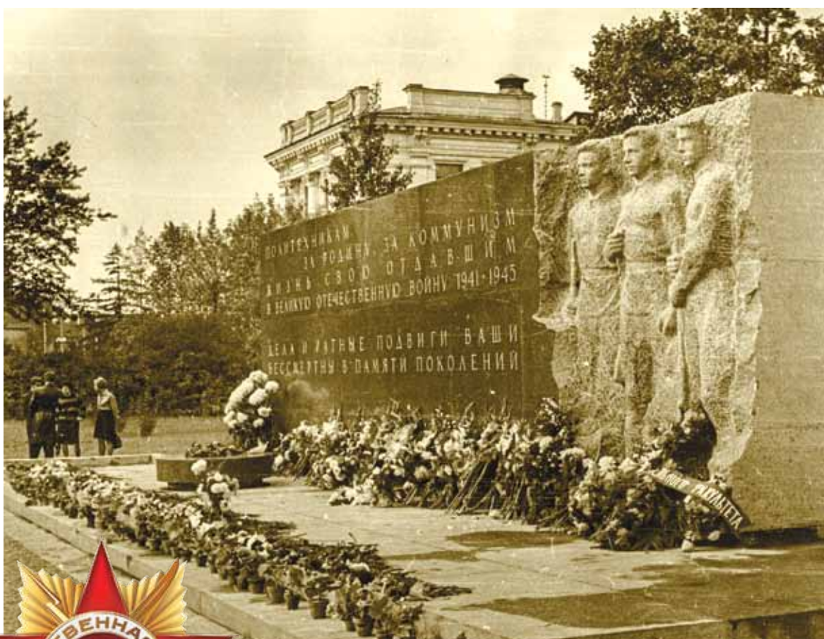
Открытие Памятника погибшим политехникам 23.09.1967