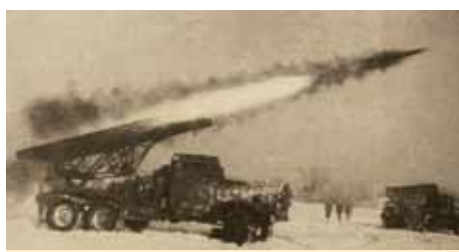
«Катюша» в бою (фронтовая хроника)