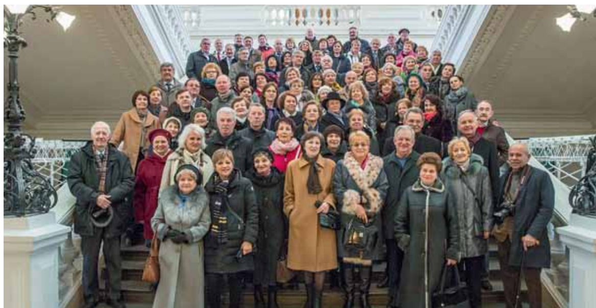
Выпускники гидротехнического факультета ЛПИ 1975 г.