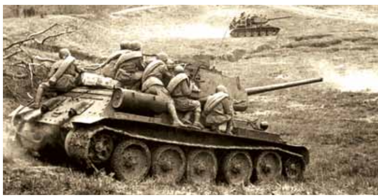
Танки Т-34 в бою (фронтовая хроника)

Уже в середине июля из добровольцев нашего вуза был сформирован 56-й истребительный батальон в составе 169 человек.