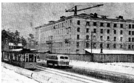
Строительство 9-го корпуса