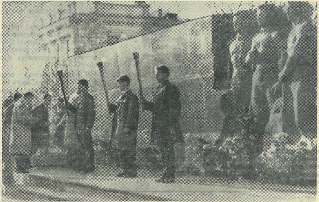
У памятника политехникам, погибшим в годы Великой Отечественной войны.

«Мы, студенты-комсомольцы Ленинградского ордена Ленина политехнического института имени М. И. Калинина решительно протестуем против возрождения фашизма в Федеративной Республике Германии, мы требуем запретить деятельность нефашистской партии. Выражаем свою глубокую солидарность с борьбой КПГ и прогрессивной общественности, восстающей против чрезвычайных законов, против стремления правящих кругов получить доступ к ядерному оружию.