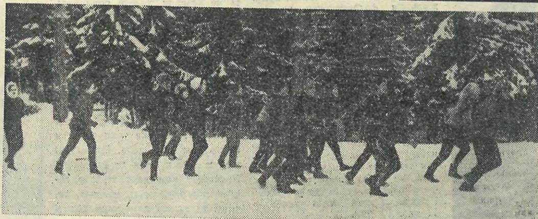
Навголово. Соревнования по регби.

ро и интересно информировать студентов - экономистов о важнейших событиях на факультете. Уже вышли в свет два листка, посвященные демонстрации трудящихся комсомольскому собранию ИЭФ. В составе редколлегии ФИЛ — фотокорреспонденты, художники, корреспонденты.