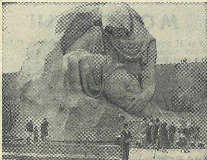
Фрагмент мемориального ансамбля в Волгограде.

Студенты, овладейте военно-прикладными видами спорта, готовьтесь к защите Родины!