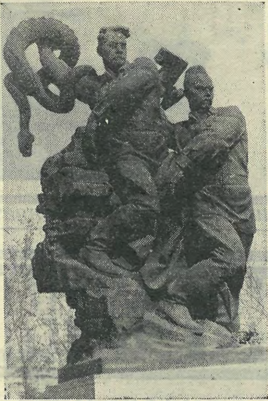
Фрагмент мемориального ансамбля в Волгограде.