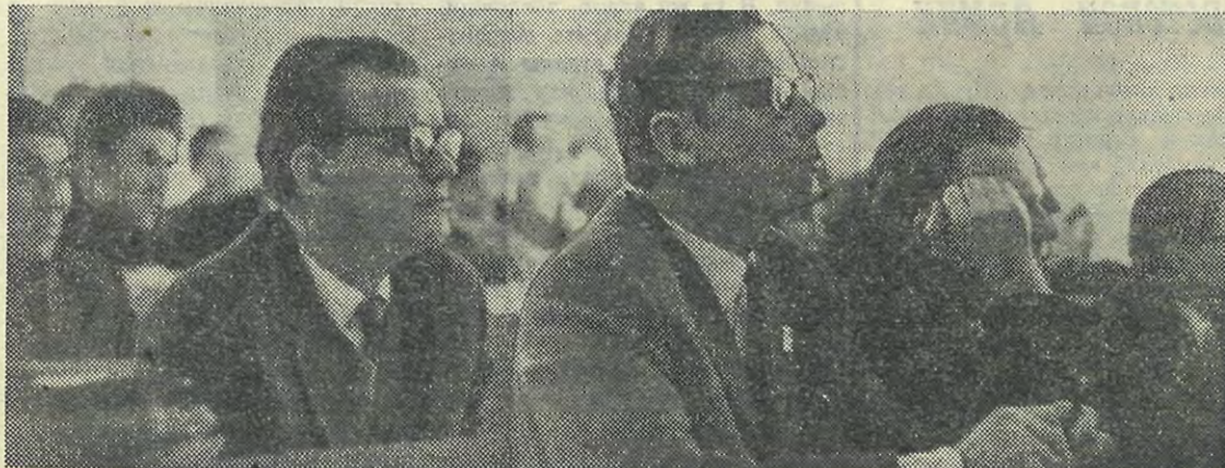
В зале конференции.