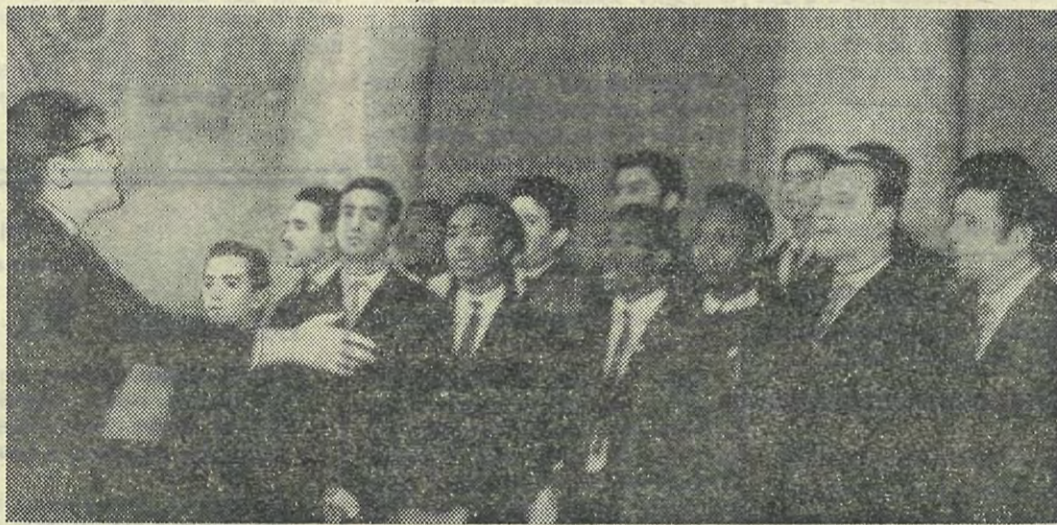
Хор подготовительного факультета исполняет песню о мире.

— Эту помощь, — сказал он, — мы принимаем как братскую помощь советского народа нашему народу.