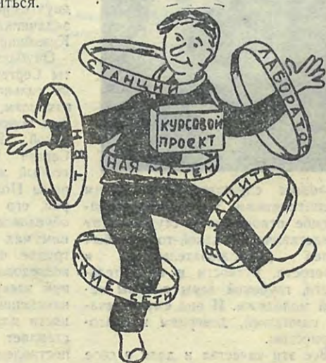
Ритмичный танец «Зачетная неделя».

Курсовое бюро не упускает из виду, что предстоит еще немалая работа над тем, чтобы газета была по-настоящему боевой, дей-