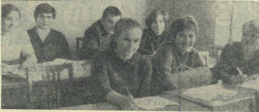
Лучшая — 412-я группа гидротехнического факультета на занятиях.