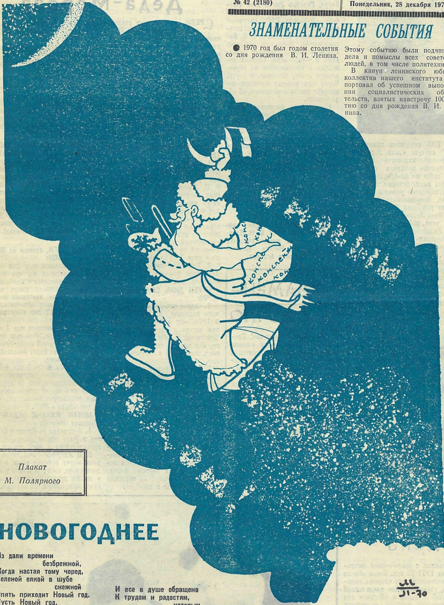
Плакат М. Полярного

● В канун 53-й годовщины Великого Октября в институте был сдан в эксплуатацию наш комбинат здоровья: больница, поликлиника, профилакторий.