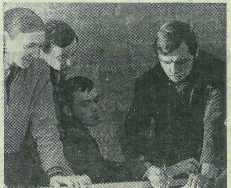
Работоспособность, глубокое знание дисциплины отличают ребят из группы 4556. Преподавание на рабфаке — один из факторов, раскрывающих эти черты.

На этой пресс-конференции участниками было задано большое число вопросов, на них были даны исчерпывающие ответы. Материалы этой конференции будут опубликованы в одном из ближайших номеров нашей газеты.