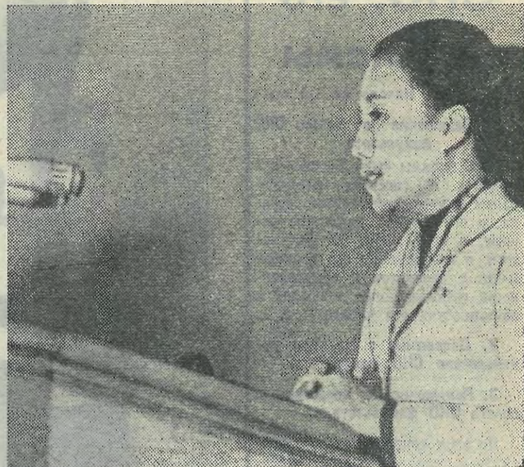
ПРОЛЕТАРИИ ВСЕХ СТРАН, СОЕДИНЯЙТЕСЬ!