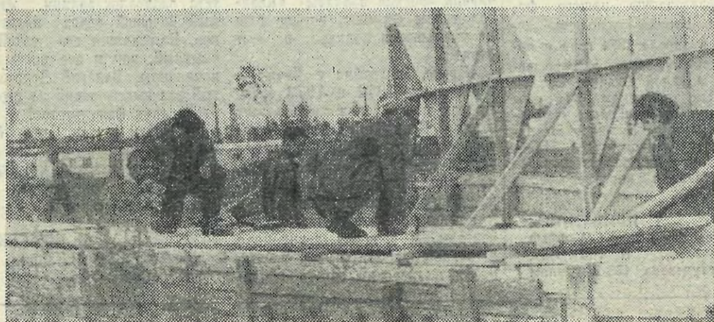
Вунтыл-73. ССО «Искатель» на прокладке теплотрассы.