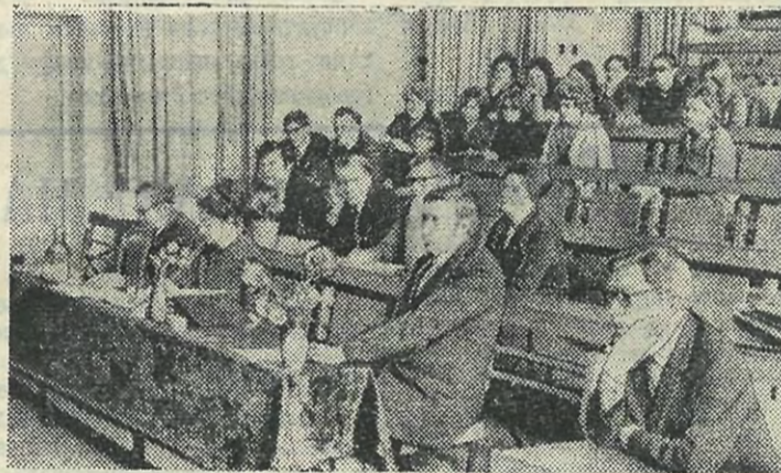
На снимке: члены государственной экзаменационной комиссии на защите.