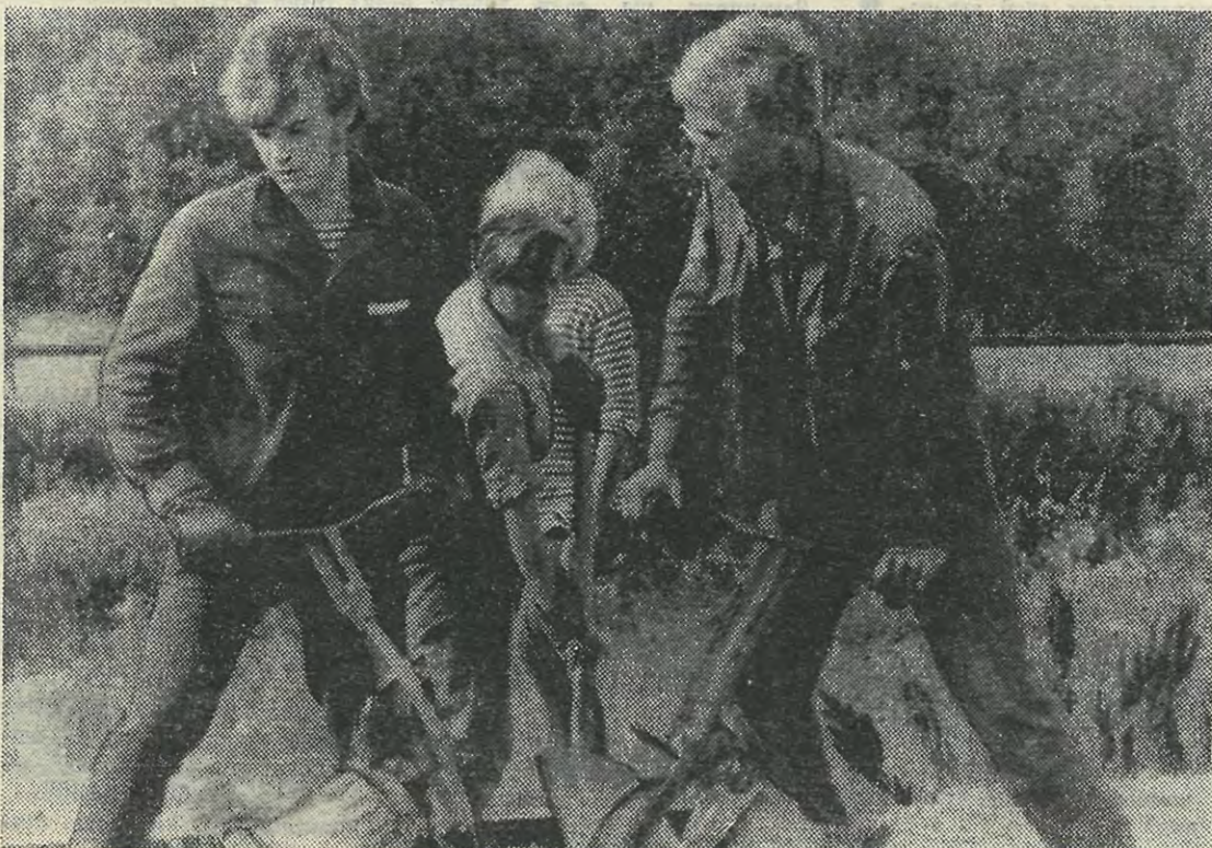
Бойцы ССО-74 «Солярис» на шопке стрелки железнодорожных путей.

Поздравляем наших депутатов и желаем им успехов в их почетной работе на благо нашей Родины!