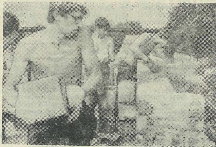
«Попадай... пошевельвайся!»

но обязательно, попробовать себя, присмотреться к другим. А главное, не выбирайте курортных мест, легкой работы — это всегда успеется. Наоборот, выберите дальние места, большую стройку.