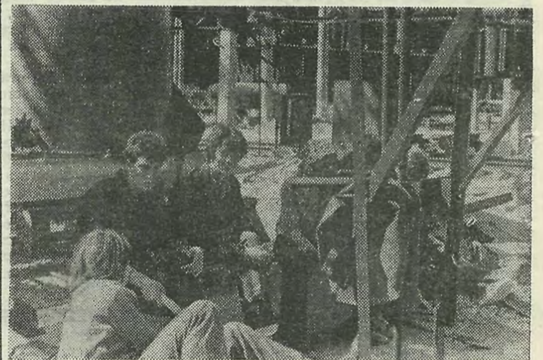
Поработали — можно и поговорить.