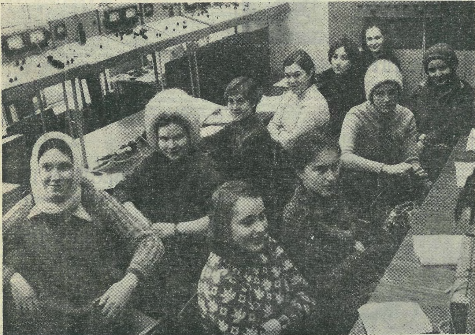
Девушки 274-й группы в лаборатории.