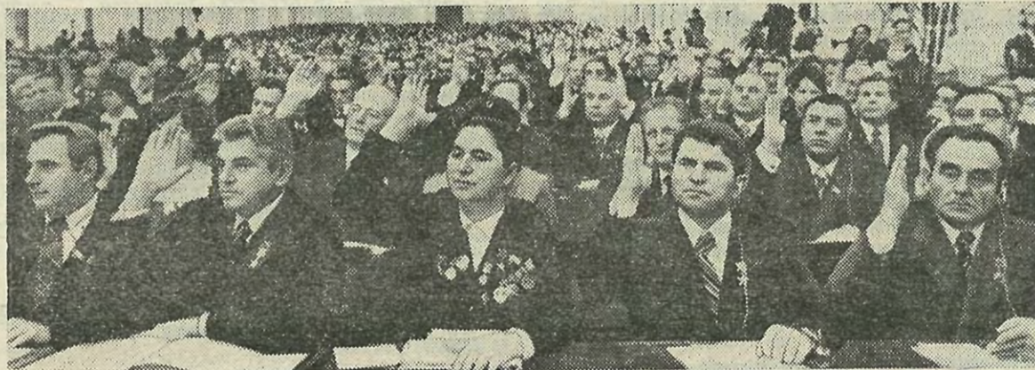
Депутаты голосуют за принятие Декларации Верховного Совета СССР.