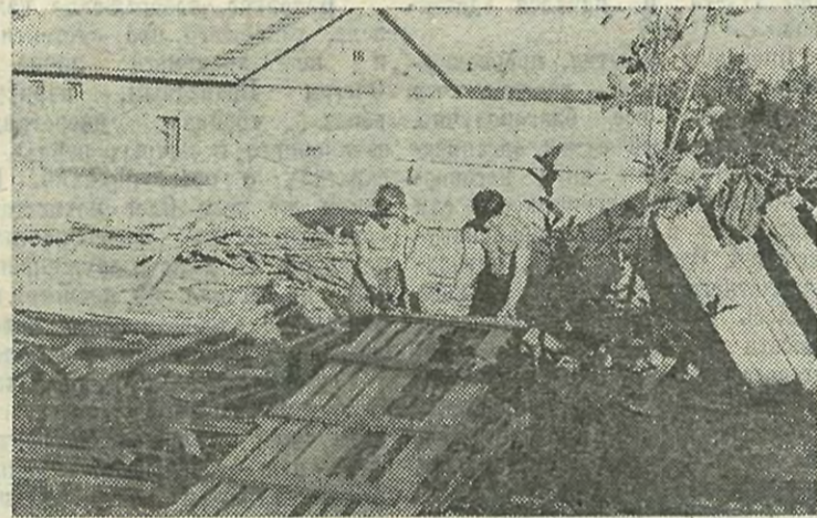
Рабочий момент в отряде.