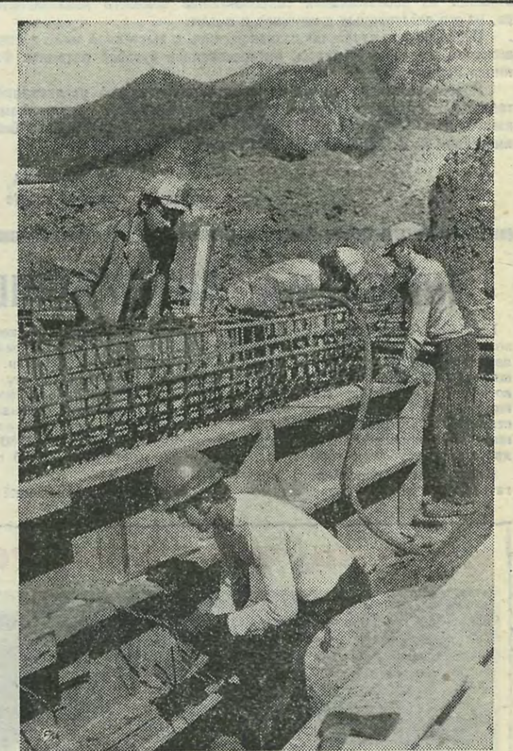
Большой вклад в крупнейшую стройку Родины, возведение Саяно-Шушенской ГЭС внесли студенты нашего института, которые, работая плечом к плечу с преподавателями ЛПИ, получили прочнейшую практическую подготовку на пути к достижению высот мастерства.