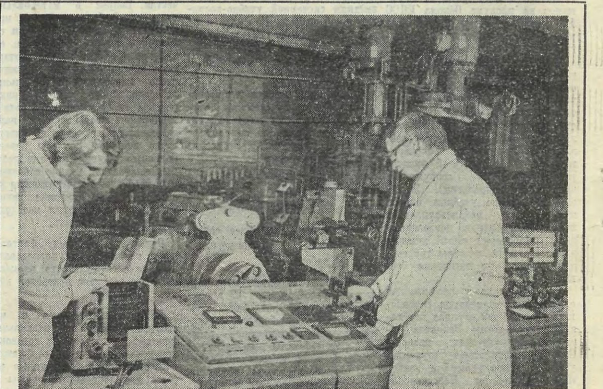
В лабораториях ЛПИ. Идет эксперимент.