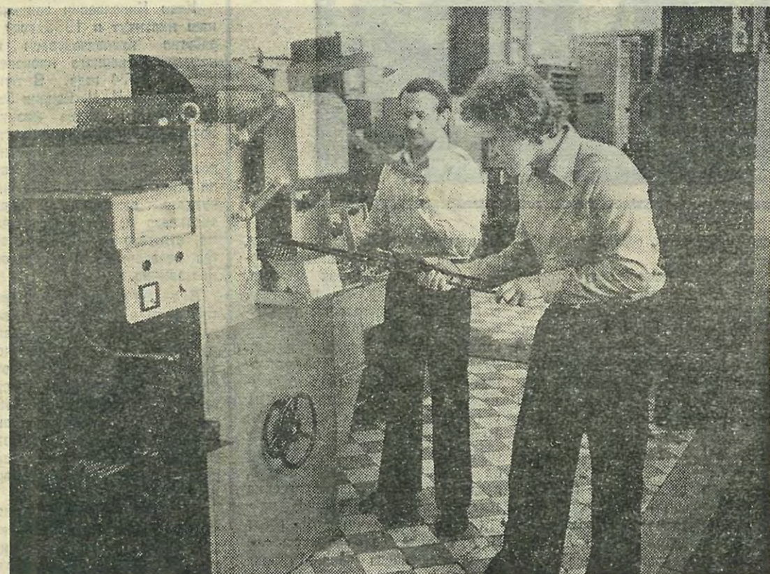
На снимке: в лабораториях института.