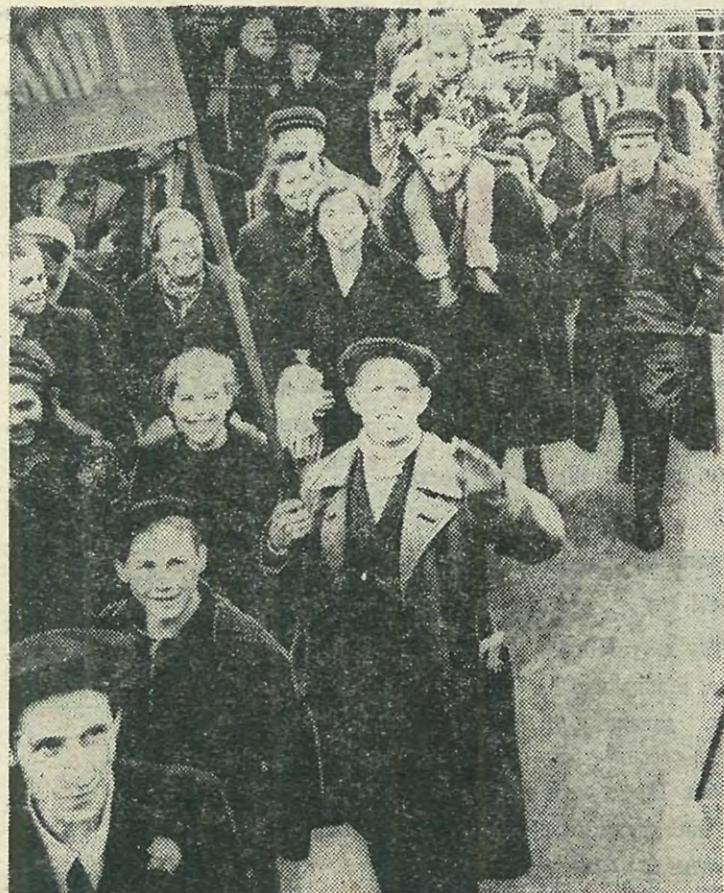
На снимке: таким был первый послевоенный Первомай.