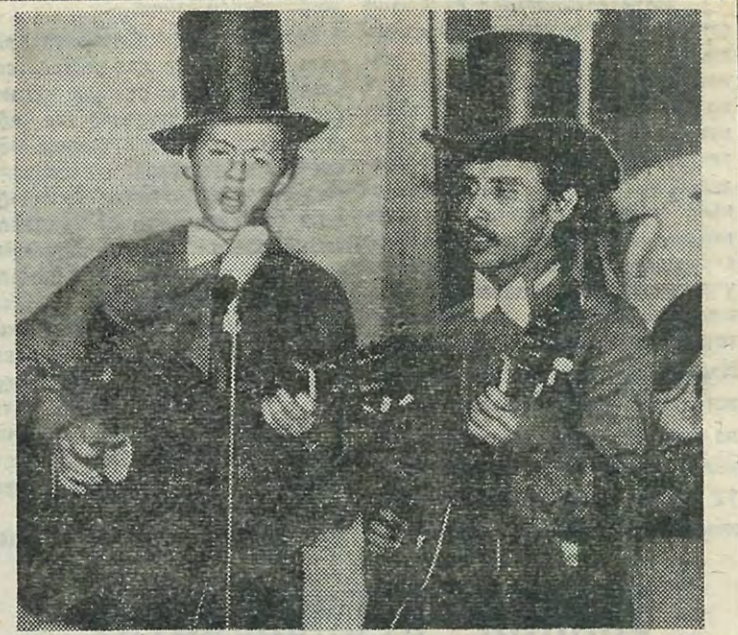
Каждый год комсомольцы ЛПИ выезжают в составе интерССО на молодежные стройки братских социалистических стран. Политехники не только ударно трудятся, но и принимают самое активное участие в культурно-массовых мероприятиях. На снимке: члены агитбригады ЛПИ выступают в зале Дрезденского диско-клуба «Спираль».

организация Политехнического института шефствует над ПТУ. Это наиболее сложный и ответственный участок работы комсомола. На XXXVII отчетно-выборной конференции отмечалось, что в деятельности комитетов ВЛКСМ факультетов по организации шефства над учреждениями нет комплексного подхода. Выполняя решения прошлой конференции, комитет ВЛКСМ разработал типовой договор о сотрудничестве между комсомольскими организациями факультета и профессионально-технического училища. На его основе комитеты ВЛКСМ шести факультетов ЛПИ, впервые в Ленинграде, заключили с ПТУ Калининского района договоры. Они способствуют укреплению комсомольской организации профтехучилища, повышению ее роли в учебно-воспитательном процессе, проведении досуга подростков, улучшении идейно-воспитательной работы в общежитиях ПТУ. Одна из задач, которую предстоит решить в будущем — снижение количества правонарушений среди учащихся ПТУ, усиление индивидуальной работы с подростками, состоящими на учете в инспекциях по делам несовершеннолетних. А. СЕРГЕЕВ