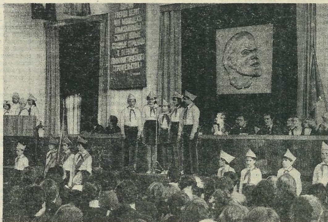
НА СНИМКЕ: пионеры подшефной 121-й школы приветствуют делегатов конференции.

В. КОЗЫРЕВА, ассистент кафедры философии