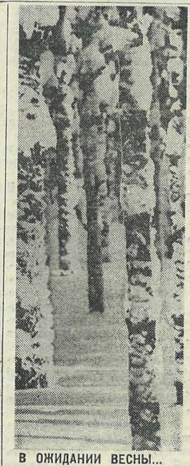
В ОЖИДАНИИ ВЕСНЫ...

Постарела уютная летняя кухня, и глаза от дождя у окошка опухли, и на яблоне первая завязь набухла, словно не было этой жестокой зимы. Дождяется кто-то меня у калитки, чья-то тонкая тень промокает до нитки, удивленные капли