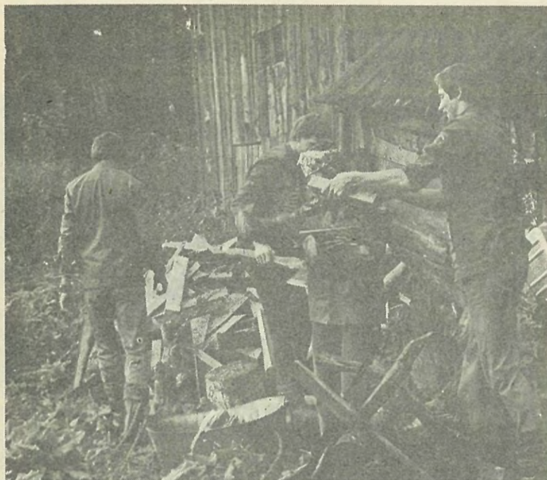
На снимке: бескорыстно, от всего сердца помогают бойцы студенческого строительного отряда «Ойкумена» ветеранам Великой Отечественной войны, которые живут в Волосовском районе.

А. КОРЕЛОВ, Э. ШУТРОВ, тренеры шахматной секции