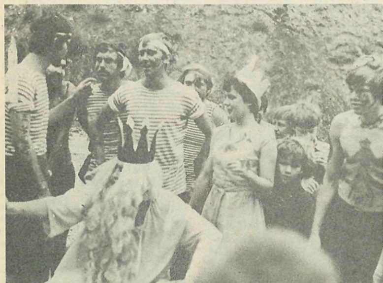
На снимке: ярким, запоминающимся праздником для бойцов студенческих строительных отрядов и жителей поселка Чермушки стал день Нептуна.