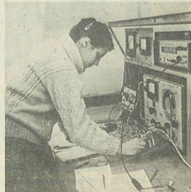
Интерес к большой науке нередко пробуждается после выполнения самой элементарной лабораторной работы...

М. МОКРАВЦОВ, член молодежной редколлегии