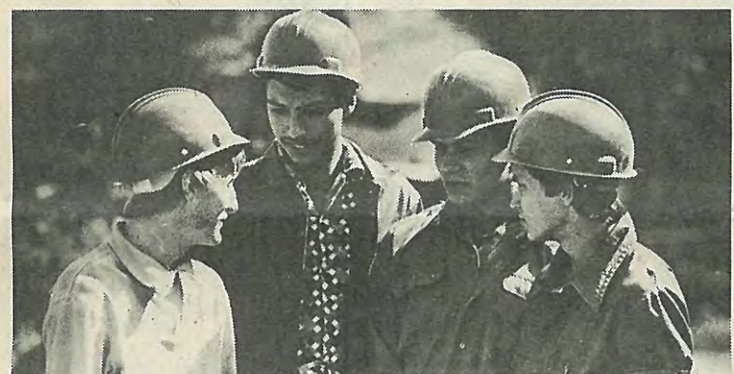
БОЙЦЫ ССО «Монолит» минувшим летом работали на объектах совхоза «Ручьи», претворяя в жизнь Продовольственную программу СССР.

И в дальнейшем коммунисты ЛПИ, весь коллектив политехников приложат максимум сил и энергии в претворение в жизнь решений майского (1982 г.) Пленума ЦК КПСС.