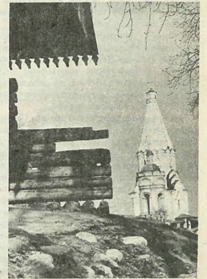
На снимке: «Коломенское».

А всего за летний период — с мая по сентябрь — Ленинградское городское бюро путешествий предлагает обслужить свыше 700 тысяч ленинградцев.