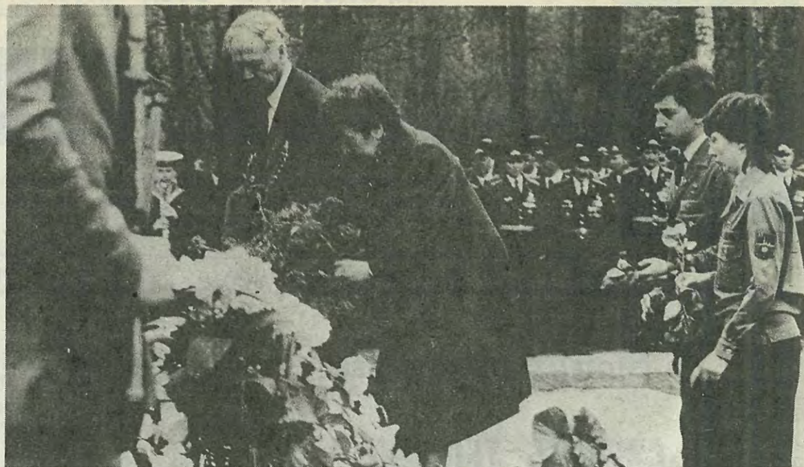
Вечная память героям, отдавшим жизнь за Родину...