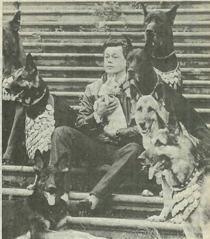
«МОИ ДРУЗЬЯ». (Заслуженный артист РСФСР Николай Караченцов).