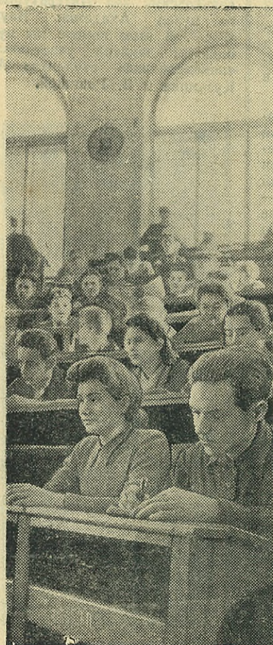
Студенты первого курса энергомашиностроительного факультета на лекции.