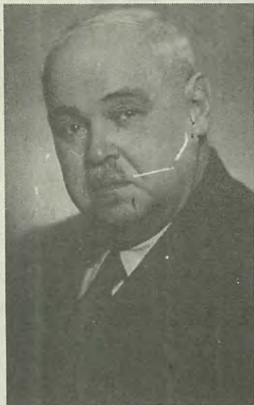
Осип Исаакович Непорент (1886—1966 гг.)

ное, разной степенью образованности, были и откровенные профессиональные невежды, пришедшие на кафедру после очередной чистки взамен неудобных или по протекции. Нередко поэтому на научных баталиях ему приходилось бесосновательно выслушивать от них недостойные, резкие слова, но он ни разу не отвечал им тем же. Правда, в этих случаях исчезала свойственная ему добрая улыбка. Он становился суровым, начинал нервничать, но сохранял сдержанность. Внешне ответы были спокойными и как всегда аргументированными, как это и подобает воспитанному человеку. Истинно преданным науке и причастным к ней людям всегда работалось рядом с Осипом Исааковичем легко и плодотворно.