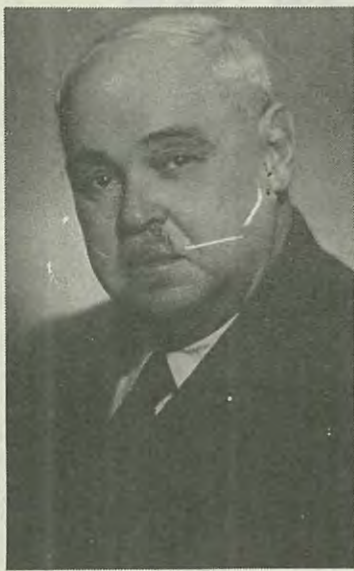
Осип Исаакович Непорент (1886—1966 гг.)

ное, разной степени образованности, были и открытые профессиональные невежды, пришедшие на кафедру после очередной чистки взамен неугодных или по протекции. Нередко поэтому на научных баталиях ему приходилось обосновательно выслушивать от них недостойные, резкие слова, но он ни разу не отвечал им тем же. Правда, в этих случаях исчезала свойственная ему добрая улыбка. Он становился суровым, начинал нервничать, но сохранял сдержанность. Внешне ответы были спокойными и как всегда аргументированными, как это и подобает воспитанному человеку. Истинно преданным науке и причастным к ней людям всегда работалось рядом с Осипом Исааковичем легко и плодотворно.