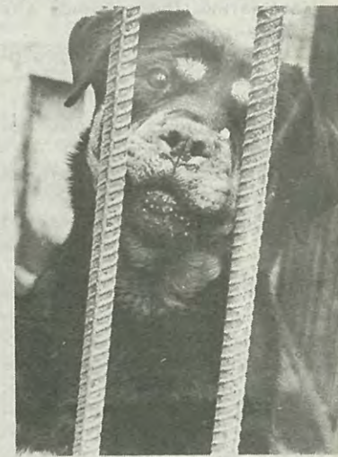
«Ребята, давайте жить дружно!»

Фирма «Политех» в этом году впервые застраховала 37 студентов-сирот на сумму 2 миллиона рублей в нашей студенческой страховой компании СПАССК.