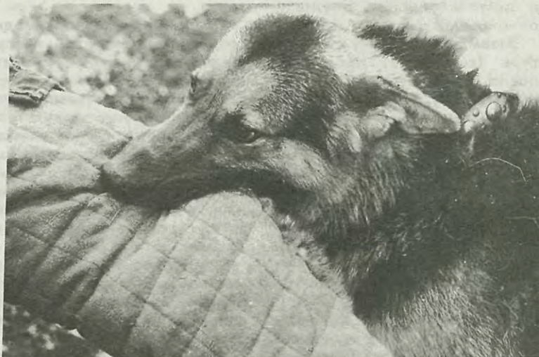
«Собака бывает кусачей только от жизни собачьей...»