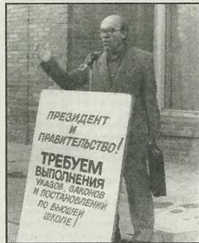
Не позволим развалить высшую школу!