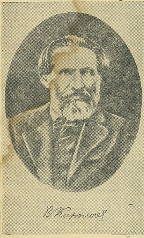
В. Л. Кирпичев

В. Л. Кирпичев, руководивший строительством института, является одним из его основателей, создателем и организатором лабораторий прикладной механики и трения.