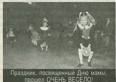
Праздник, посвященный Дню мамы, прошел ОЧЕНЬ ВЕСЕЛО!

Для сведения жителей округа: административная комиссия работает каждый четверг с 15.00 в помещении Муниципального совета «Муниципального округа Академический» по адресу: ул. Вавиловых, 13/1, тел.: 555-44-68.