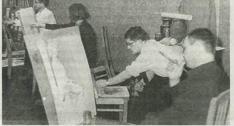
В изостудии ЛПИ

Ю. КУШЕВ, наш корр. № 41 от 24.11.1960 г.