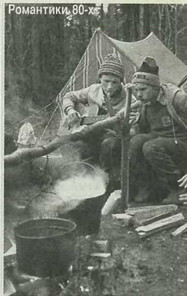
№ 31 от 21 ноября 1990 года Мы возвращаемся на «Авось»

Не секрет, что большинство студентов едет в «дальние» стройотряды с единственной целью — побольше заработать. Это не явилось исключением и при формировании нашего отряда — ССО «Авось» (радиофизический факультет). И тем приятнее было наблюдать рождение, становление и возмужание настоящего коллектива, ведь отряд существует первый год и не имеет за спиной богатых традиций.